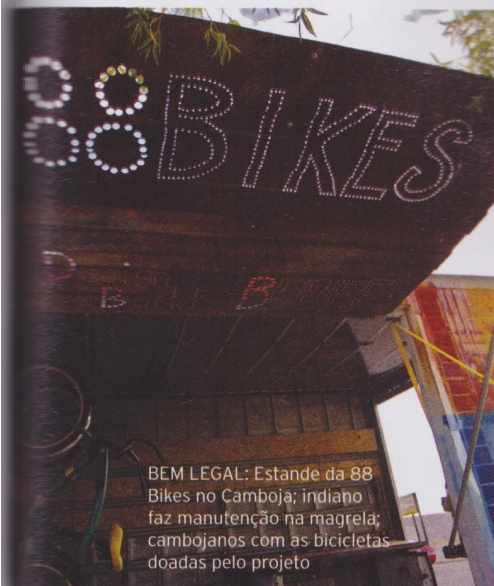
BEM LEGAL: Estande da 88 Bikes no Camboja; indiano faz manutenção na magrela; cambojanos com as bicicletas doadas pelo projeto