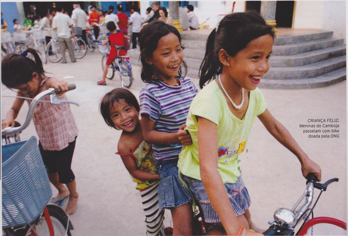
CRIANÇA FELIZ: Meninas do Camboja passeiam com bike doada pela ONG

A ONG norte-americana 88 Bikes distribui bicicletas para jovens carentes, provando o quanto a magrela pode transformar o mundo para melhor